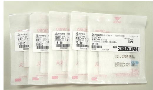
一点一点の診療材料にRFIDラベルを貼り付け